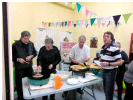
Soirée des bénévoles de la MJC où chacun a pu mettre la main à la pâte (à crêpes, bien sûr !)