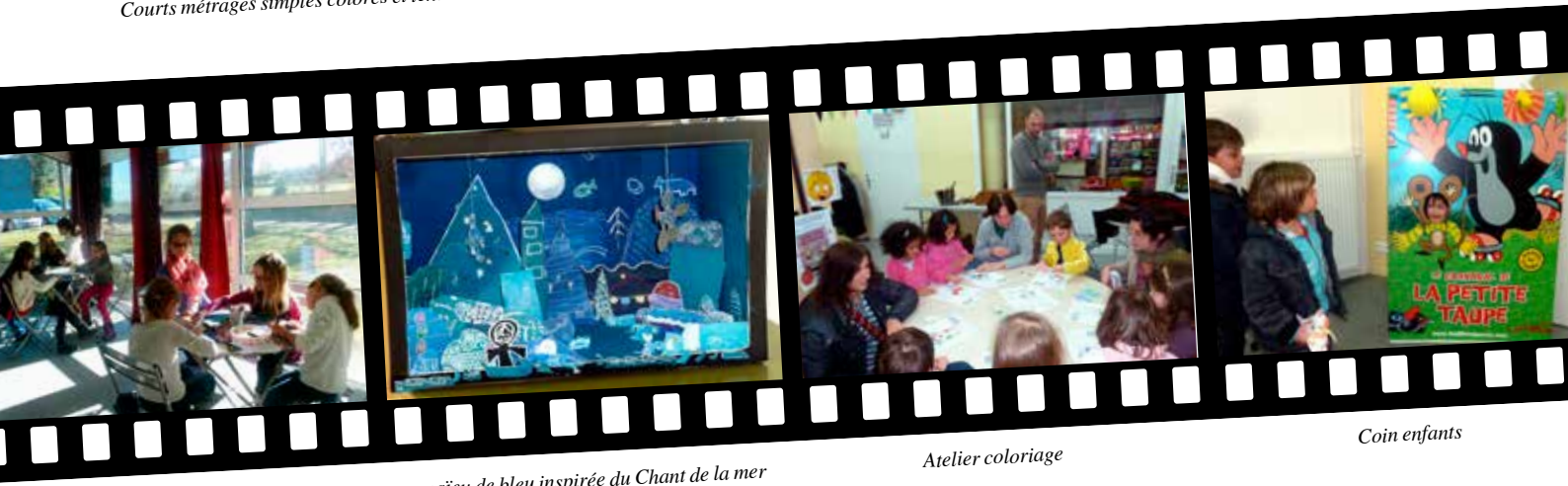
Fabrication d'une « boîte à images » toute en camaïeu de bleu inspirée du Chant de la mer