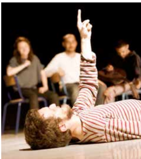
Hortense : spectacle d'improvisation théâtrale et musicale