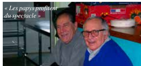
« Les papys profitent du spectacle »

réalisait des tours qui illuminaient de surprise les visages enfantins - euh ! Enfin, il y avait quelques papys accompagnateurs qui semblaient, eux aussi, se laisser griser par le spectacle.