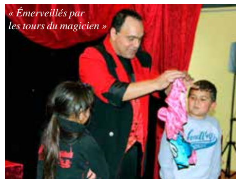
« Émerveillés par les tours du magicien »

Mercredi 14, le rendez-vous était donné à Studio 7 « aux Grands » pour assister à la projection du film Le grimoire d'Arkandias « Les Petits », étaient regroupés, le 28, bien au chaud, dans la salle des fêtes d'Auzielle pour le spectacle Magic Show : un prestidigitateur, en faisant participer des enfants