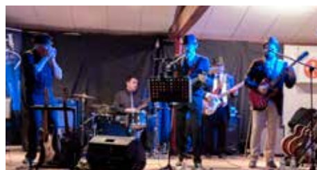
Soirée Blues avec le groupe Up To No Good