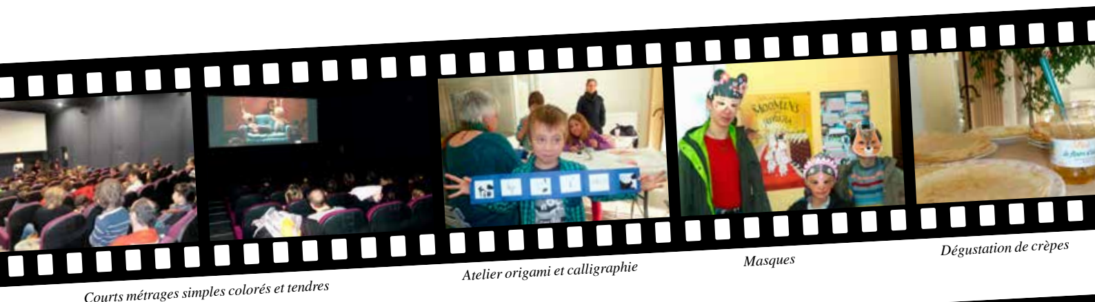
Courts métrages simples colorés et tendres